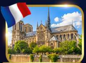
มหาวิหารนอทร์เดอรัดาบ