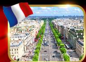
เดินเล่นย่านช็องเซลีซ