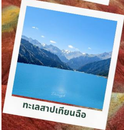
ทะเลสาบเทียนฉือ