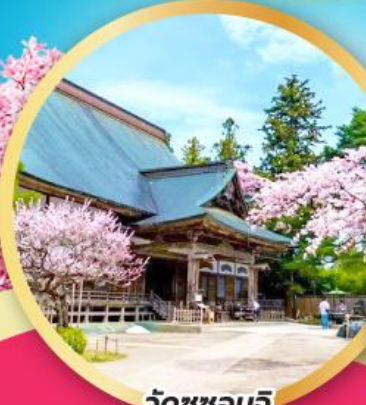
วัดชูซอนจิ