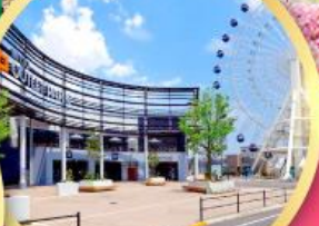
มิตซูเอากะไลท์พาร์ค เซนได