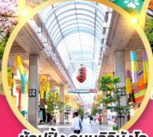
ช้อปปิ้ง ถนนอิชิบังโจ