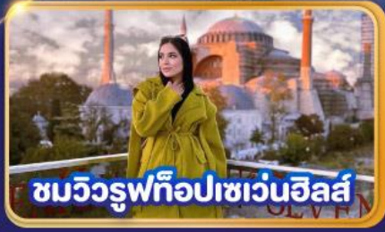
ชมวิวยูพีทือปเซเวนฮิลส์