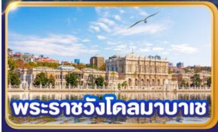
พระราชวังโดลมาบาซ