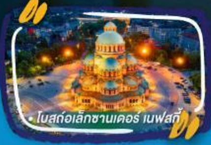
• โบสถ์อเล็กซานเดอร์ เนฟสกี