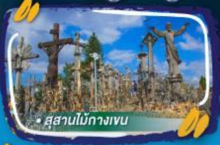
• สุสานไม้กางเขน