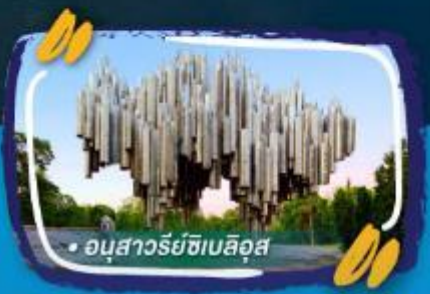
• อนุสาวรีย์ซิมลิส