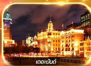
เดอะบอนด์