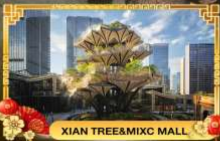
XIAN TREE&MIXC MALL