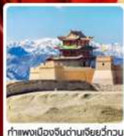
กำแพงเมืองจีนด่านเสียวี่กวน

• ไซโล่...เส้นทางสายไหม ชมสระบัววังพระจันทร์ ทะเลทรายหมีงาช้าง กำแพงเมืองจีนด่านสุดท้าย "เจียยี่กวน" มรดกโลกภูเขาสายรุ้งจางเย่