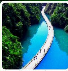
หุบเขาสิงโต

เดินทาง มีนาคม - ธันวาคม 2569 ราคาเริ่มต้น 15,888