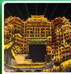
ตึกหัดจอร์รี่ 72

• โฮลท์ อุทยานเทียนเหมินซาน ประตูสวรรค์ ตึกหัดจอร์รี่ 72 หมู่บ้านโบราณฟูรงจิ้น ภูเขาไร้อาถุ่เจียโต อุทยานสื่อจ้อกวนด่านสิงโต