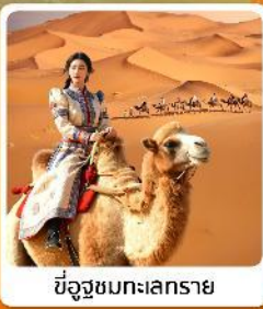
ขี่อูฐชมทะเลทราย