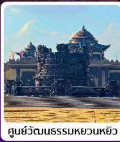
ศูนย์วัฒนธรรมหยวนหยิว