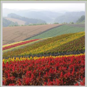
"SHIKISAI NO OKA"