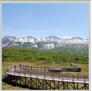
"SHIRETOKO 5 LAKES"