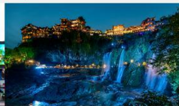
ฝูหรงเจิน

*ทางบริษัทฯ ขอสงวนสิทธิ์ในการสลับโปรแกรมทัวร์ตามความเหมาะสมขึ้นอยู่กับสถานการณ์หน้างาน โดยคำนึงถึงผลประโยชน์ของลูกค้าเป็นสำคัญ