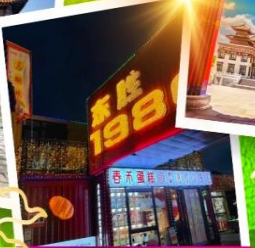
ถนนคนเดินคังบาร์ซี