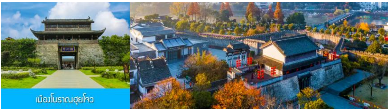
เมืองโบราณสุโจว

จากนั้นนำท่านเดินทางโดยรถบัสสู่ เมืองโบราณสุโจว (ระยะทาง 149 กม. ใช้เวลาเดินทางราว 2 ชั่วโมงเศษ)