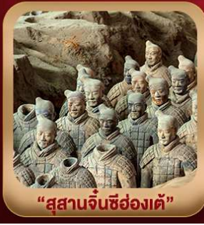
"สุสานจีนซีฮ่องเต้"