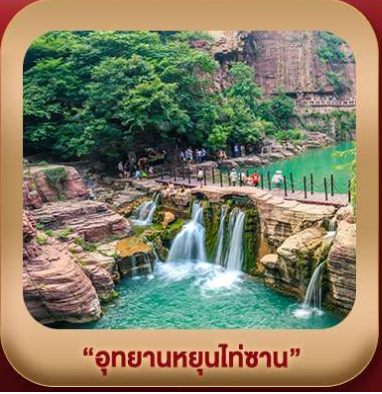
"อุทยานหยุนไท่ซาน"

ชมถ้ำหลงเหมิน มรดกโลกที่เมืองลั่วหยาง • สุสานจีนซีฮ่องเต้ • ศาลเจ้ากวนอู วัดเส้าหลิน + ป่าเจดีย์ + ชมโชว์กังฟู • เมืองโบราณลั่วหยาง • อุทยานหยุนไท่ซาน เจดีย์ห้าพันปี • ถนนวัฒนธรรมต้ากิง • ถนนคนเดินอิสลาม • จัตุรัสหออระขิง