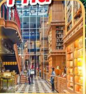
ร้านไอศกรีมมียาฮาระ