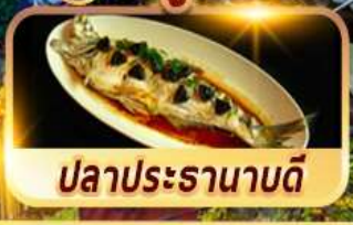
ปลาประรานาบดี