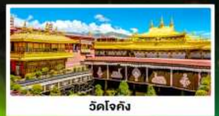
วัดโจกิง