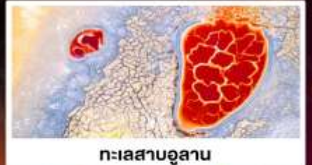
ทะเลสาบอูแลกัน

พักระโอมพื้นที่เมือง แบบกันสนิม มีห้องน้ำในตัว