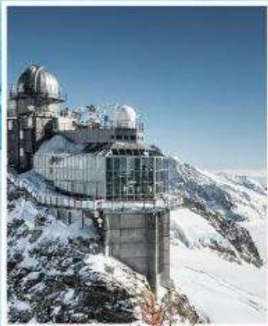
JUNGFRAUJOCH "Top of Europe"