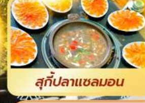
สุกี้ปลาแซลมอน