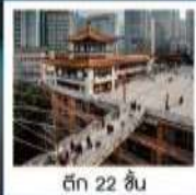
ตึก 22 ชั้น