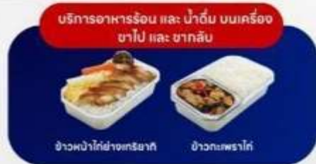
บริการอาหารร้อน และ น้ำดื่ม บนเครื่อง ขาไป และ ขากลับ