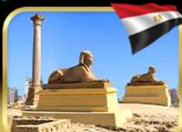
เสาริมันปอมเปย์