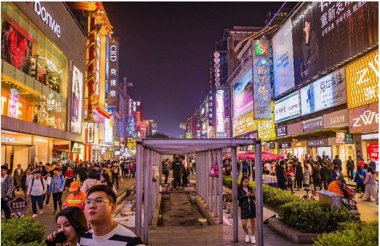
T2G-CSX16SL ZhangJiajie...ฉางซา จางเจียเจี้ย ฟู่หลงเจิ้น เฟิ่งหวง สะพานแก้ว 6D 5N (SL)