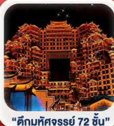
"ตึกมหัศจรรย์ 72 ชั้น"