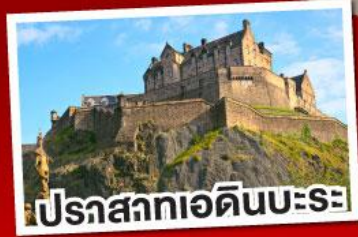
ปราสาทเอดิินบะระ