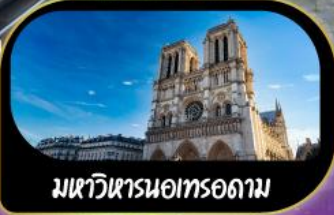
มหาวิหารนอทรอดาม