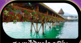
สะพานไม้ฆาปค ลูซิริน