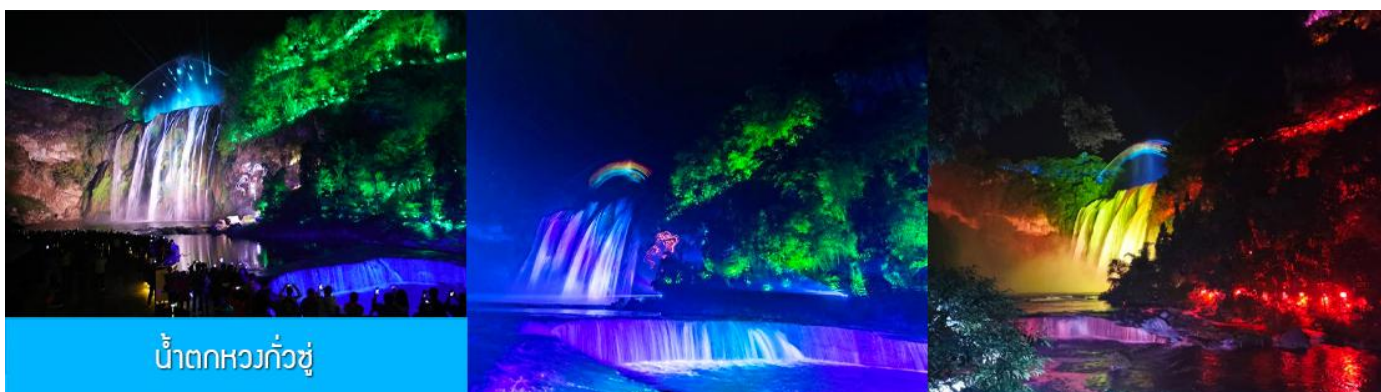
น้ำตกหวงกั๋วซู

รับประทานอาหารเย็น ณ ภัตตาคาร (มื้อที่ 6)