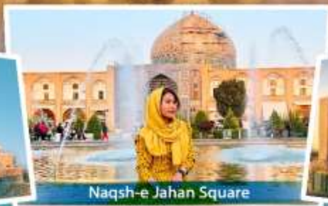
Naqsh-e Jahan Square