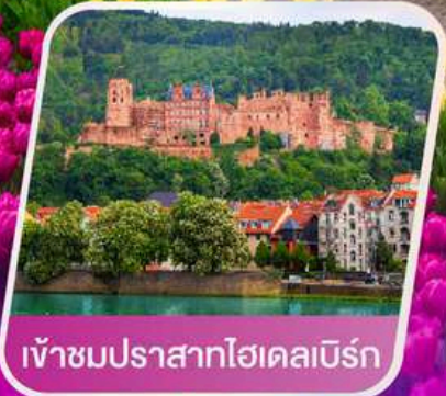
เข้าชมปราสาทไฮเดิลเบิร์ก