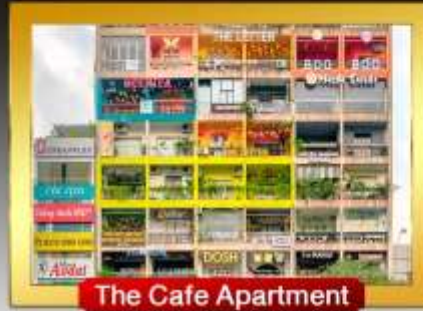
The Cafe Apartment