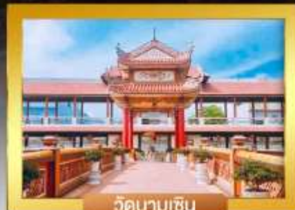
วัดนามเซิน