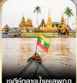
เจดีย์กลางน้ำเยเลพญา