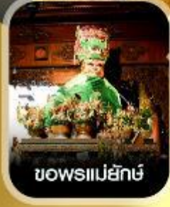
ขอพรแม่ยี่กั้ง