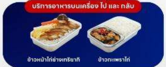
บริการอาหารบนเครื่อง ไป และ กลับ