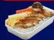
ข้าวหน้าไก่ย่างทรียากิ