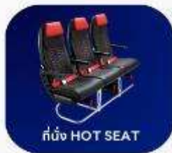
ที่นั่ง HOT SEAT