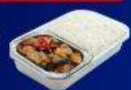
ข้าวกะเพราไก่