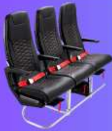
ที่นั่งมาตรฐาน

12.05 น. ออกเดินทางสู่ เมืองโฮซาง้า ประเทศญี่ปุ่น โดยสายการบิน THAI AIR ASIA X (XJ) เที่ยวบินที่ XJ610