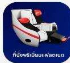
ที่นั่งพรีเมียมเฟลตเบด