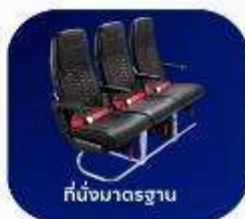
ที่นั่งมาตรฐาน