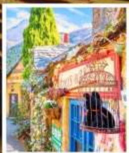
หมู่บ้านยูฟูอินพลอร์รัล