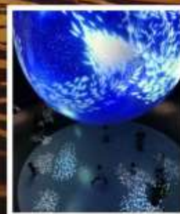
พิพิธภัณฑ์สัตว์น้ำนิเพส