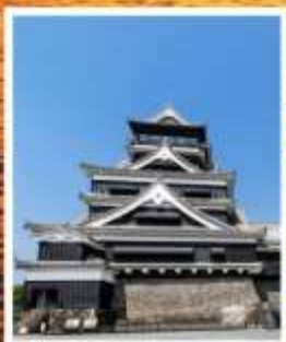
ปราสาทคุมาโมโตะ