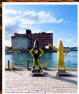
โมจิโกะทาวน์