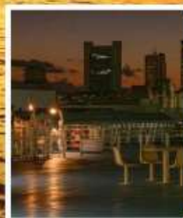
Meimon Taiyo Ferry