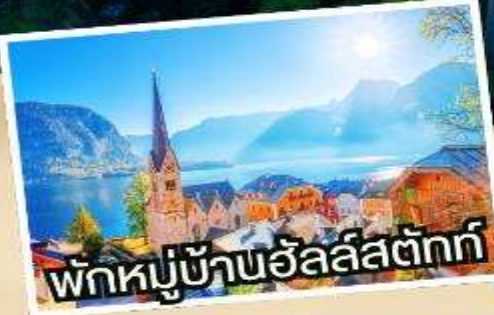
พิกหมู่บ้านอัลส์ตัดท์