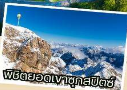
พิชิตยอดเขาชุกสปีตซ์