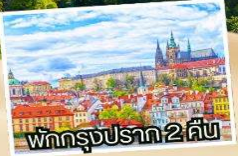
พักกรุงปราก 2 คืน