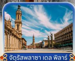
จัตุรัสพลาซ่า เดล ฟัวร์