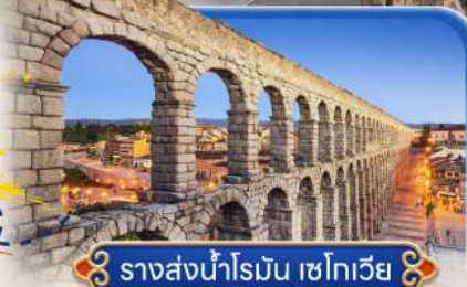
รางส่งน้ำโรมัน เซโกเวีย

สายการบินสัญชาติสเปน ✕ บินตรง Full Service