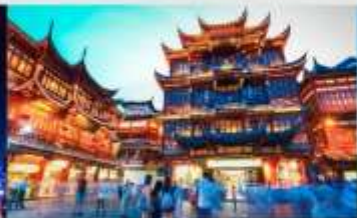
ตลาดร้อยปีเงินหวังเมี่ยว