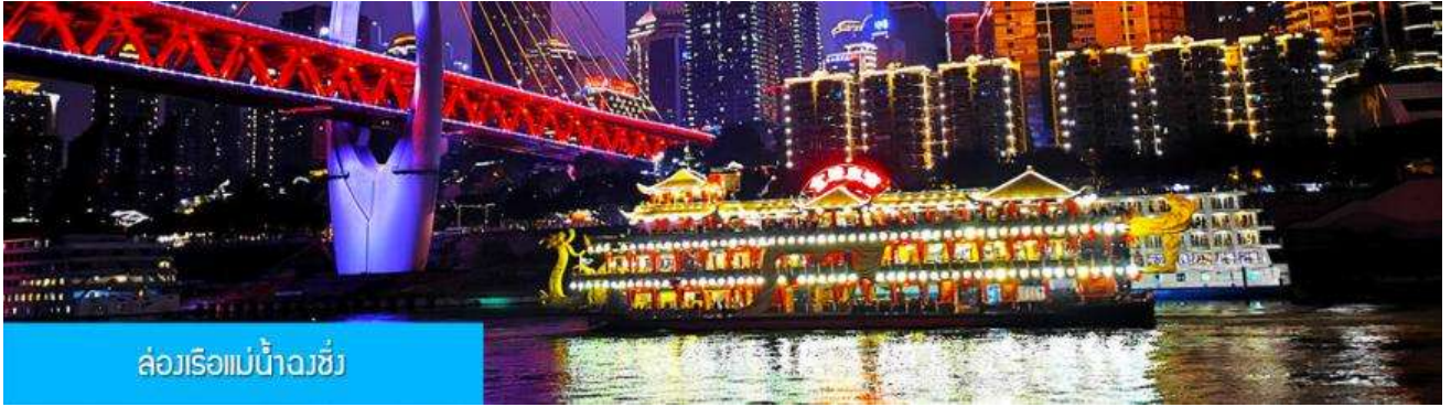
ล่องเรือแม่น้ำฉางชิ่ง

รับประทานอาหารค่ำ ณ ภัตตาคาร (เมนูสุกี้หม่าล่าต้นตำหรับจงซิ่ง)