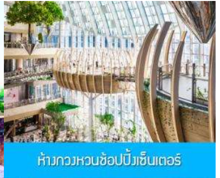
ห้างกวางหวนช้อปปิ้งเซ็นเตอร์

วันที่ห้า เมืองจงซิง-เมืองโบราณฉือชิว-กวางหวนช้อปปิ้งคอมเพล็กซ์ –บินกลับกรุงเทพฯ (ดอนเมือง)