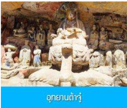
อุทยานต้าจู้

พักที่ BORRMAN HOTEL โรงแรมระดับ 4 ดาวหรือเทียบเท่าในเมืองฉางชิ่ง