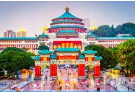
ศาลาประชาชน

พักที่ DAWEI YING HOTEL โรงแรมระดับ 4 ดาวหรือเทียบเท่าในเมืองอู่หลง