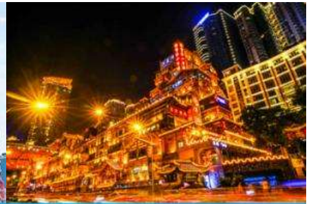
ย่านหยงหยาดัง