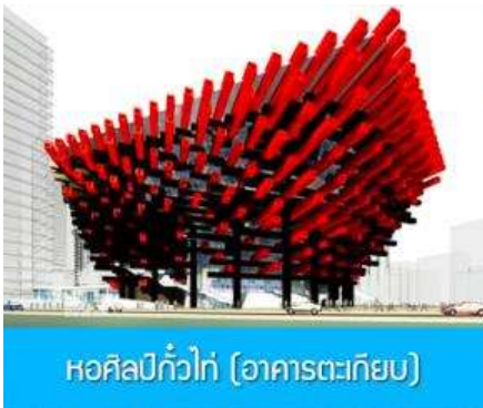
หอศิลป์กั๊กโก๋ (อาคารตะเกียบ)