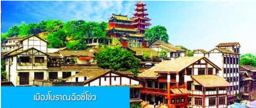
เมืองโบราณฉือชิว

พักที่ BORRMAN HOTEL โรงแรมระดับ 4 ดาวหรือเทียบเท่าในเมืองจงซิง