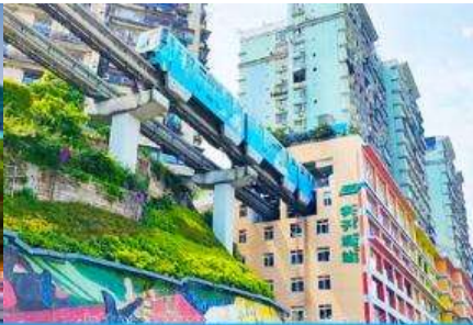
รถไฟวิงกะลุติ๊ก