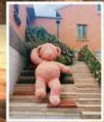
ลักซ์ชิวรี่ แลนด์มาร์ค จางหยวน