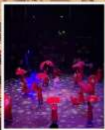
โชว์ ERA SHANGHAI CIRCUS WORLD