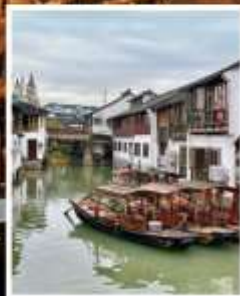
หมู่บ้านโบราณ จูเจียเจี้ยว