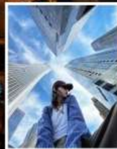
3 ตึกใหญ่ แห่งเซี่ยงไฮ้