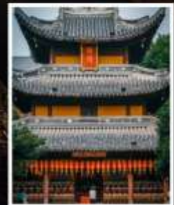
วัดหลงหัว