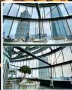
ร้านหนังสือตัวอ้วน