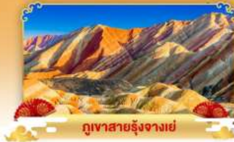
ภูเขาสายรุ้งจางเย่