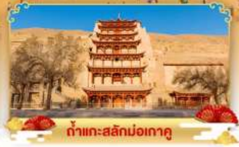
กำแพงสลักม่อเถาตู

เดินทางโดย : สายการบินโซนาอิสิเทิร์นแอร์ไลน์ & เชียงไฮแอร์ไลน์