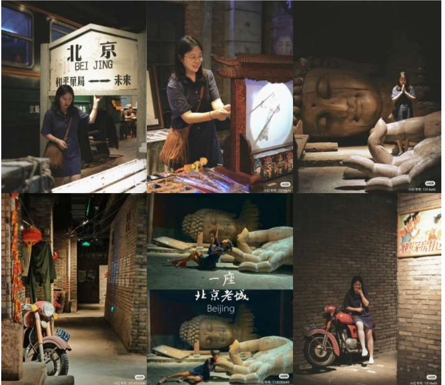
ขอบคุณเจ้าของภาพ (เครดิตตามภาพ)