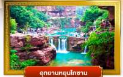
อุทยานหยุนไถซาน