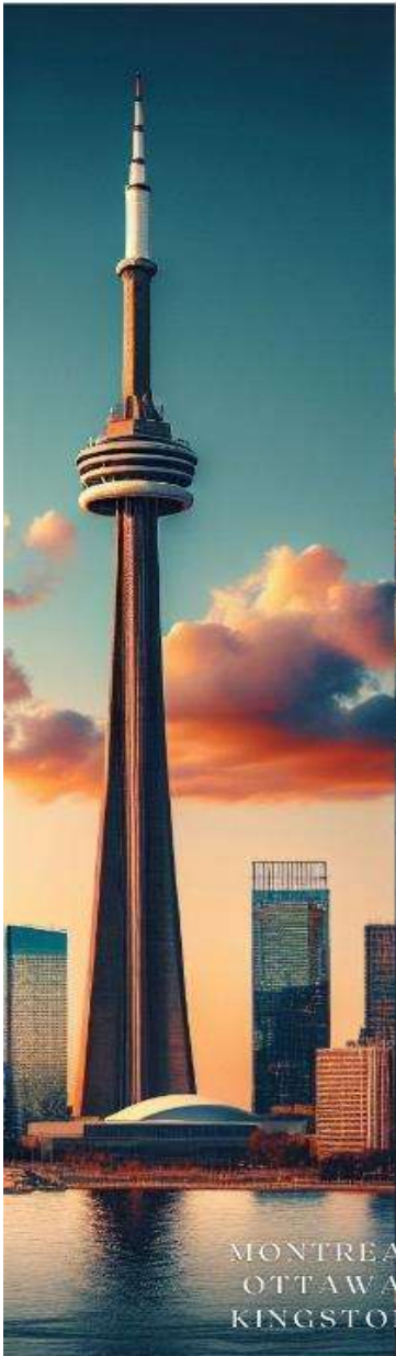
MONTREAL OTTAWA KINGSTON

พักโรงแรมวิวห้าตึกในแองการ่า 5 ดาว สายการบินเอมิเรตส์ รวมค่าวีซ่าแคนาดา&ทิปพนักงานขับรถ