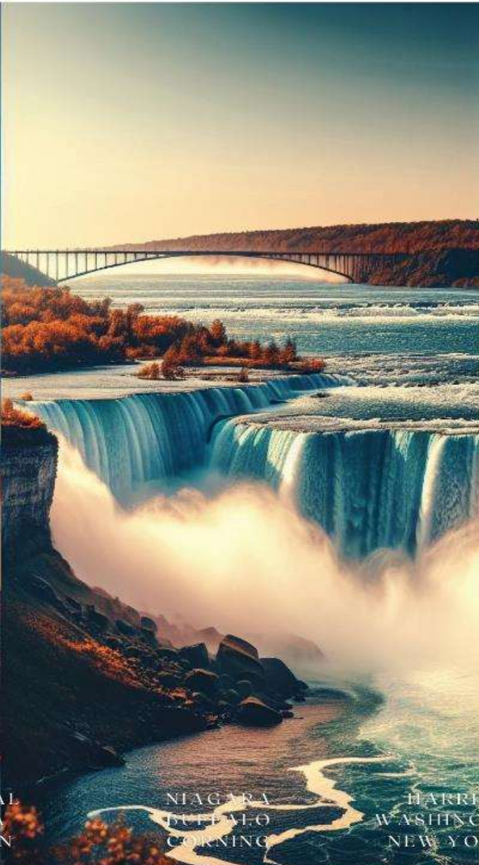
NIAGARA BUFFALO CORNING