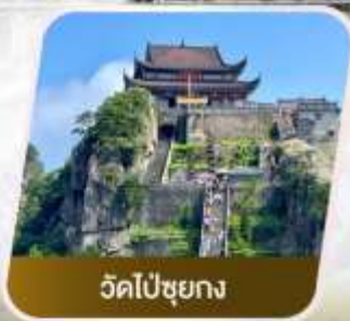
วัดไป๋ชุง