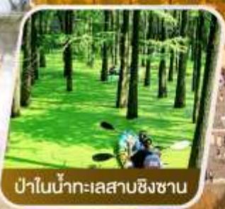
ป่าในน้ำทะเลสาบซิงซ่าน