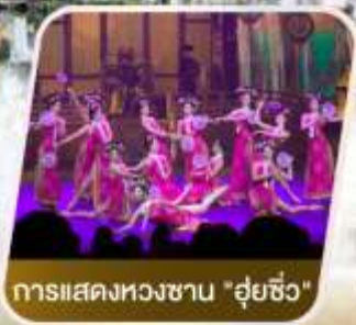
การแสดงหองซ่าน "อุ้ยซิว"