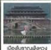
เมืองโบราณผิงหวง