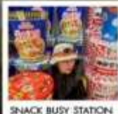
SNACK BUSY STATION