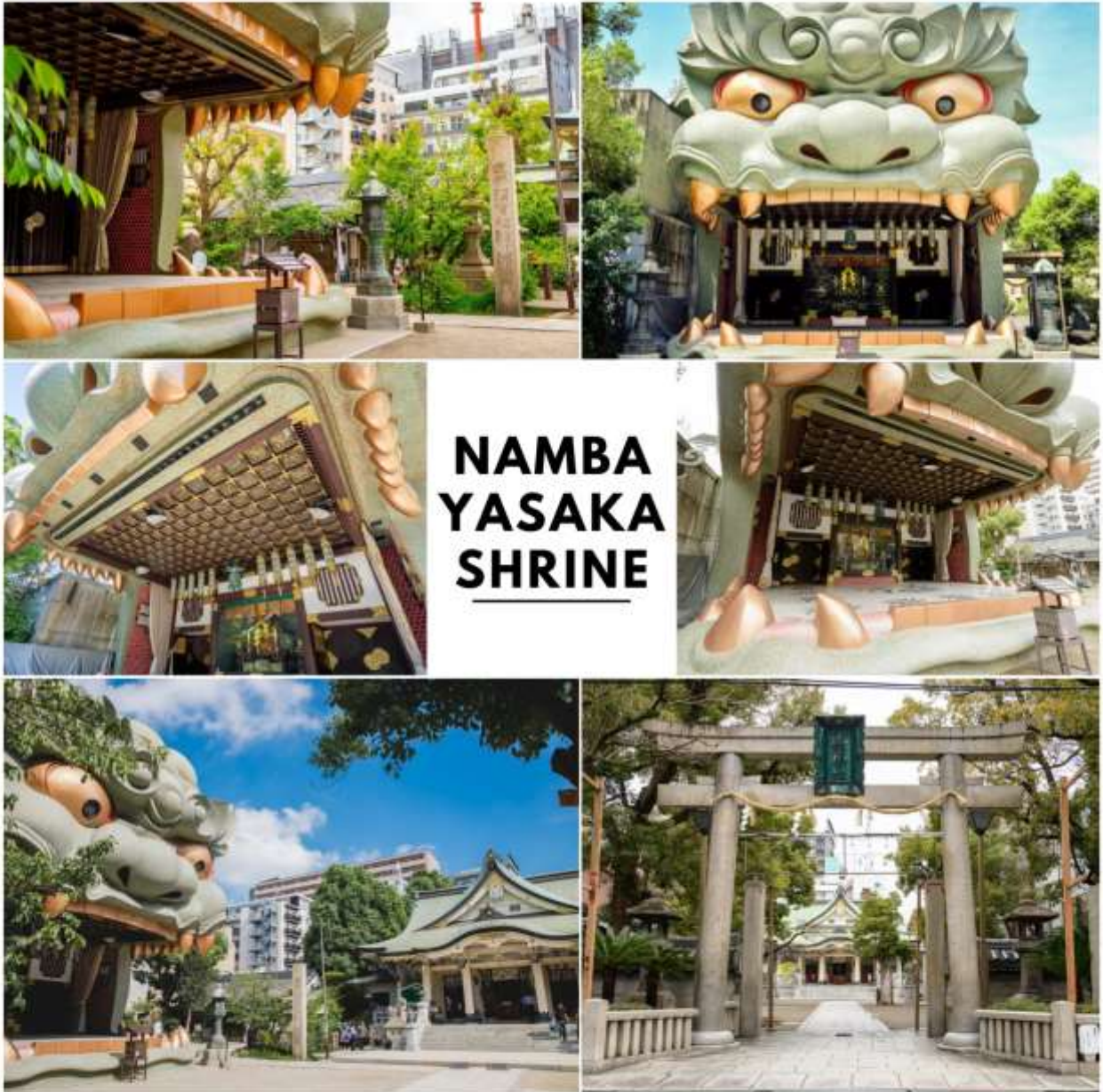
รูปภาพใช้เพื่อประกอบการโฆษณาเท่านั้น

จากนั้นนำท่านสู่ ศาลเจ้านัมบะ ยาชากะ (Namba Yasaka Shrine) อยู่ในย่านนัมบะของเมืองโอซาก้า มีเอกลักษณ์ที่โดดเด่นอย่างหัวสิงโตปั้นหน้าตาดุดันขนาดใหญ่ตั้งอยู่ด้านหน้า ด้วยความสูง 17 เมตร ความกว้าง 11 เมตร และความลึก 7 เมตร โดยเชื่อกันว่าปากของสิงโตตัวใหญ่นั้นจะสามารถกลืนกินสิ่งไม่ดีต่าง ๆ ปิดเป่าความชั่วร้ายให้หายไป และนำพาโชคลาภเข้ามา ซึ่งกลายเป็นที่นิยมสำหรับนักท่องเที่ยวที่จะมาสักการะขอพระเครื่องหรือด้านการทำงานให้เกิดความสำเร็จตามที่มุ่งหวัง อีกทั้งด้วยงานปั้นสิงโตที่มีเอกลักษณ์โดดเด่นแม้จะมีใบหน้าท่าทางที่จะดูดูไปอยู่บ้างก็กลายเป็นจุดถ่ายรูปยอดนิยมสำหรับผู้ที่มาเยือนศาลเจ้าแห่งนี้เลยทีเดียว