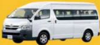
VAN (2-8 ท่าน)