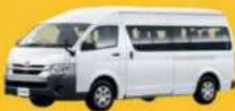
VAN (2-8 ท่าน)