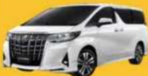
Alphard (2-4 ท่าน)