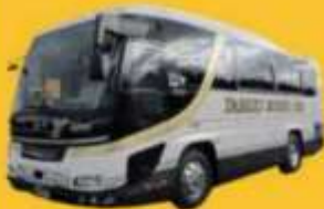
Bus (10-20 ท่าน)

➔ สำหรับท่านที่ต้องการความเป็นส่วนตัวมากขึ้น ท่านสามารถเลือกใช้บริการ รถส่วนตัวได้โดยมีรูปแบบรถให้เลือกถึง 3 ประเภท โดยรถ แต่ละประเภทสามารถนั่งได้ตั้งแต่ 2 ท่านขึ้นไป