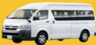
VAN (2-8 ท่าน)