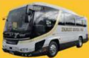
Bus (10-20 ท่าน)

➔ สำหรับท่านที่ต้องการความเป็นส่วนตัวมากขึ้น ท่านสามารถเลือกใช้บริการ รถส่วนตัวได้โดยมีรูปแบบรถให้เลือกถึง 3 ประเภท โดยรถ แต่ละประเภทสามารถนั่งได้ตั้งแต่ 2 ท่านขึ้นไป