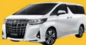
Alphard (2-4 ท่าน)