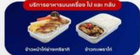
บริการอาหารบนเครื่อง ไป และ กลับ