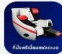
ที่นั่งพรีเมียมพลอบ