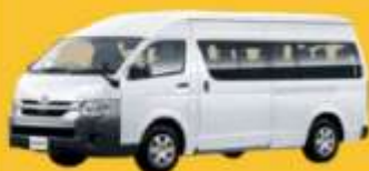
VAN (2-8 ท่าน)