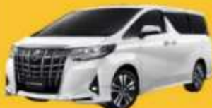
Alphard (2-4 ท่าน)