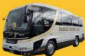
Bus (10-20 ท่าน)